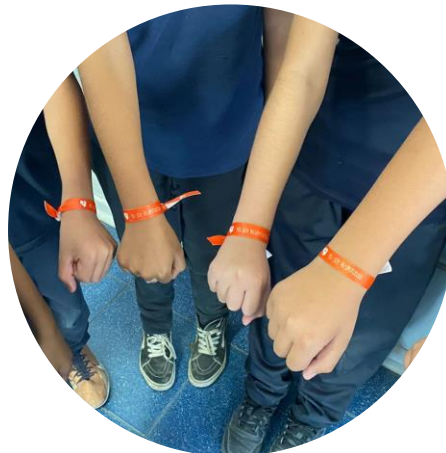
Reconocimiento inmediato: stickers, pulseras, anotaciones positivas